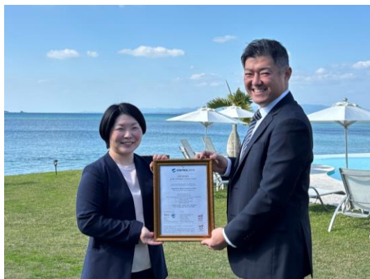
・ 認証書授与式 Certificate Award Ceremony

■ January 9, 2026 (Fri): An official event was held to commemorate the achievement of GSTC certification.