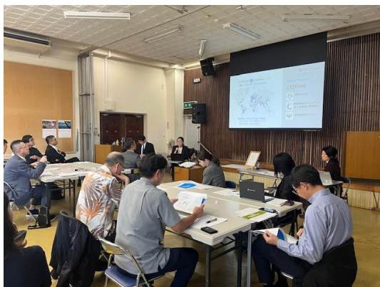
・ 第三者国際認証機関による講演会 Lecture by the Independent International Certification Body

Organized by: Ishigaki City Tourism and Exchange Association (General Incorporated Association)