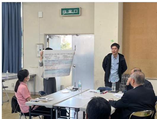
・ グループディスカッション Group Discussion “For Sustainable Tourism in Ishigaki City”