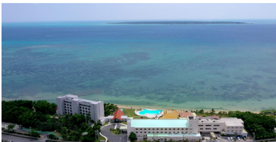
・自然に囲まれた環境 竹富島を望む A tranquil environment surrounded by nature, with views of Taketomi Island.

Support from JaSCA and LOOPORT Co., Ltd. In achieving this certification, we received comprehensive support from the Japan Sustainability Coordinator Association (JaSCA) and LOOPORT Co., Ltd., organizations specializing in sustainable tourism. Based on their professional expertise, they helped organize and visualize our long-standing initiatives in alignment with international standards while providing extensive support in building a framework to preserve and pass on the nature and culture of the Yaeyama Islands.